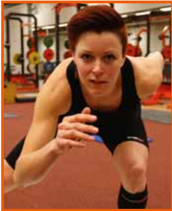
Jorien ter Mors (schaatsster) Tweevoudig Olympisch Kampioen schaatsen

"De lange broek van Knap'man® helpt mij sneller en beter herstellen na trainingen en wedstrijden. Hij zit geweldig. Ik draag hem ook altijd tijdens het reizen."